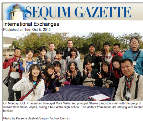
訪問を伝える地元紙のホームページ (生徒訪問団 17名)