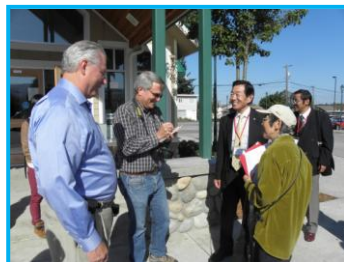
地元紙の取材を受ける