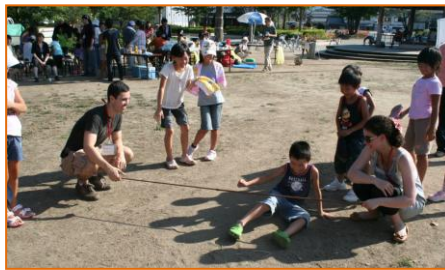
思わず座っちゃいました。。