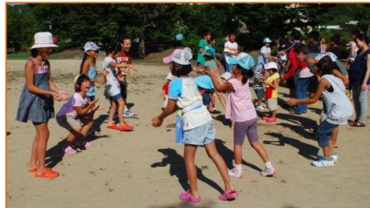
水入り風船投げに子どもたちは大はしゃぎ!!

アメリカンサイズのホットドックにクッキーとポテトチップス付きでお腹いっぱい!! みんな大満足でした!!