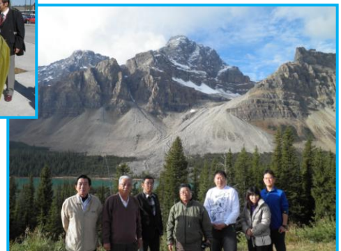
カナディアンロッキー(世界自然遺産)にて