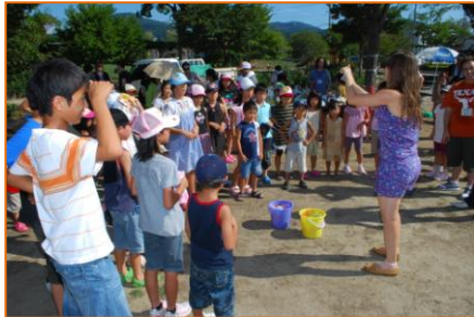
ALTのゲーム説明を真剣に聞く子どもたち

There was a picnic at Yume park with Shiso's ALTs. 64 people joined. The kids enjoyed games and understood the English explanation. They could learn English and different culture.