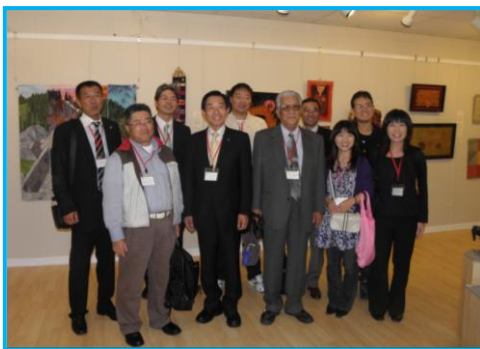
ミュージアム&アートセンター (スクイムの歴史博物館)

We visited Sequim in America (our sister city). This visit is the second time since Shiso city was formed. There were 17 junior high school students and 7 residents on this trip, including the mayor of Shiso city. We visited the Japanese garden, a wastewater treatment plant and a Japanese style retirement home. We were also greeted with kindness and warmheartedness through the welcome party and homestay families even though there are difference in language and culture. Moreover we could also visited Consulate-General of Japan in Seattle. This was a very valuable experience. We visited wide open places and natural heritage site in Canada. We had a wonderful time in America and Canada.