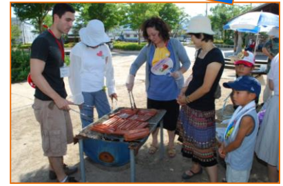
暑い中ぶるぶる汗で頑張りました☆