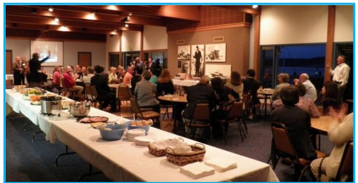
スクイム市歓迎パーティー☆