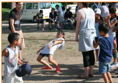
リンボーダンスに悪戦苦闘!!