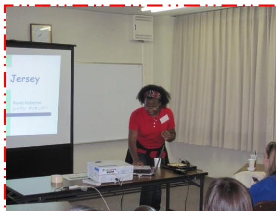
☆レイベン先生(山崎東ALT) ニュージャージー州のお話