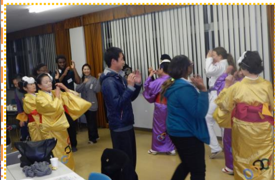
宍粟の伝統文化を学ぼう♪