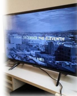
映画鑑賞会 今回はホラー