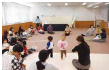
動く・こどもの館号がきたよ! 12月 5日 市役所北庁舎で

エクササイズや音楽を使った親子で体験できる催しが開かれます。月により内容は変わります。