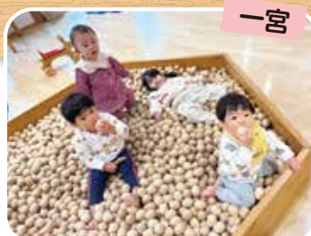
ひのきのたまごプール