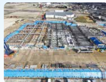
1月時点の上空写真