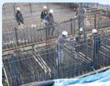
コンクリート打設