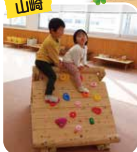
ウッドマウンテンミニ