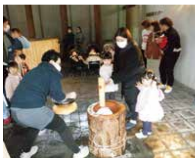
ぺったんぺったん!もちつき大会 12月25日 エーガイヤちくさで