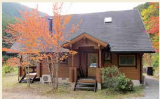
パン屋と民泊を行っている山崎町大谷ログハウス

任期終了後の活動に向けて山崎町に引っ越し、以前から行っていた釣り竿の製造販売に加え、7月にパン屋、11月には民泊を始めました。今後は民泊を通じて宍粟市の魅力を市外へ発信し、より多くの方に宍粟市を訪れていただきたいと思います。