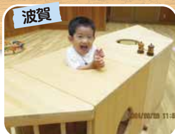
穴栗のヒノキオリジナル トンネルくぐり