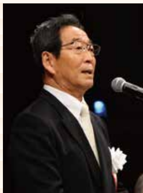
二十歳の祝典で参加者に エールを送る市長(1月11日)

立春を過ぎたとはいえ、 まだまだ寒い日が続いてお ります。皆さま元気でお過 ごしでしょうか。