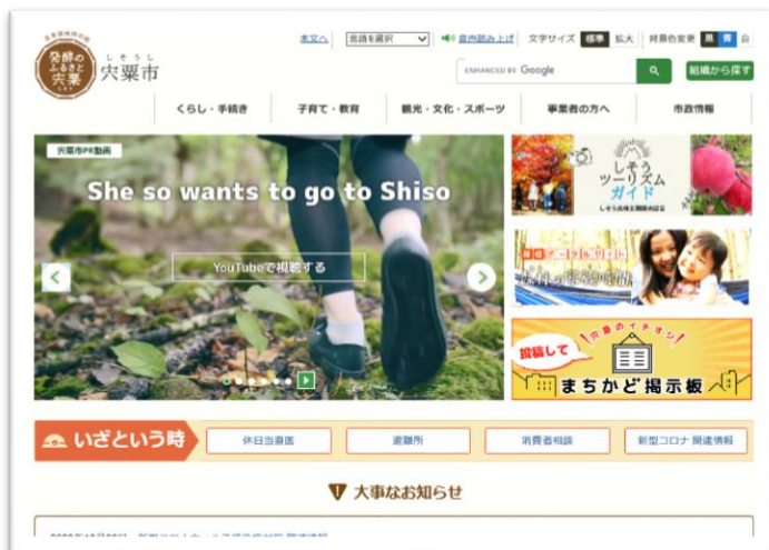
市公式サイトトップページ