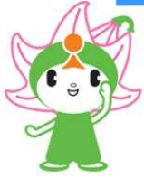
穴栗市キャラクター しーたん