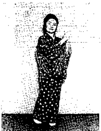
⑤ 足を左右左と進み右足を横に。両手左上横でチョンと打つ(④の反対動作)。