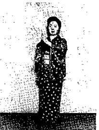
⑨ 右足を軽くふみ、両手タッチするように右手下、左手上。