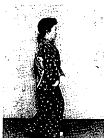
⑪ ⑦の動作をする時に、少しひざをおり両手は前に。