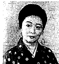
振付 表現・花柳與桂

踊り方：この踊りは盆踊り風にヤグラを中心 に右向け右に進み、円をつくり8呼 間聞いて①の動作に入ります。