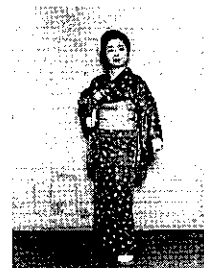
③ 左足を軽く二度タッチするように両手は軽くにぎり右手胸に左手少し横に(②の反対動作)。