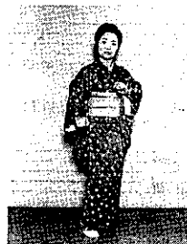
② 右足を軽く二度タッチするように両手は軽くにぎり、左手を胸に右手少し右横に。