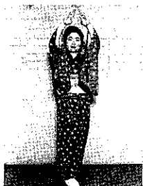
⑥ 右足を出し、両手指先を合せるように。