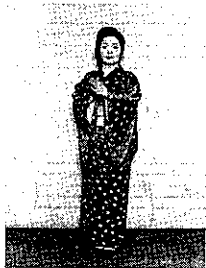
① チョチョンのチョンと打つ。