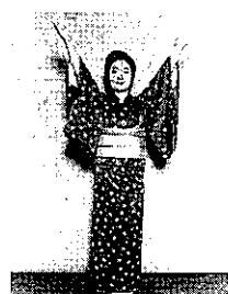
⑧ 左足を前にそろえて、両手中から外上に広げる(末広びらき)。