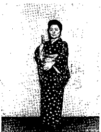
⑩ 左足を軽くふみ、両手タッチするように右手上、左手下。又もう一度⑨の動作をする。