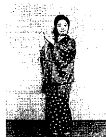
④ 足を右左右と進み、左足を横に。両手右上横でチョンと打つ。