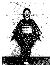
⑦ 足をそのまま、両手上から下に広げるようにおろす。