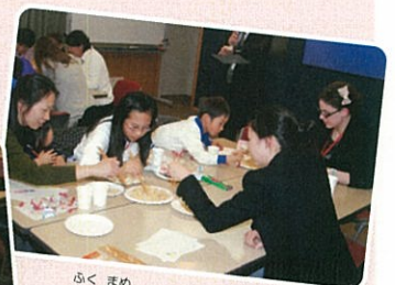
ふく まめ 福(豆)をつかむぞ!