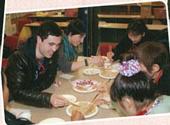
ころころ ころころ