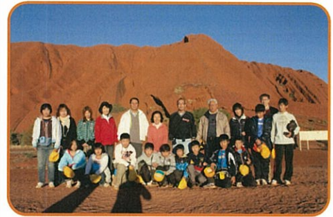
エアースロック記念撮影