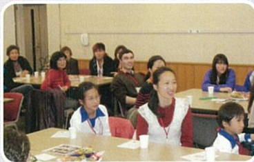
講師のお話に参加者