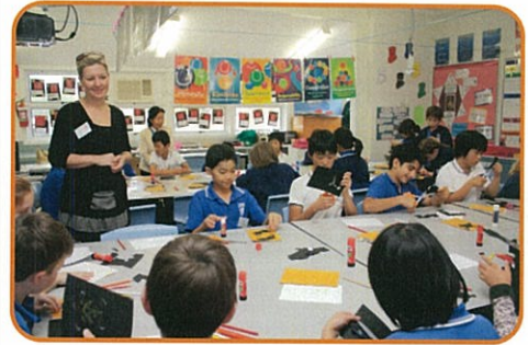
アイアンサイド小学校での交流授業

※平成23年1月サイクロンによる洪水は、当該小学校地域を含め大きな被害をもたらし、義援金募集いたしました。義援金のご協力ありがとうございました。 <野原日豪親善交流会>