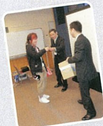
参加者全員にクリスマスプレゼント♪