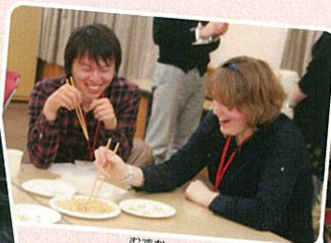
むすか ワオ☆難しい!!