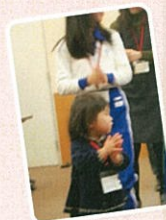
恒例となりつつある「炭坑節」3歳の女の子もとっても上手でした☆