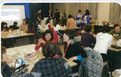
フリートークは各テーブル大盛り上がり!