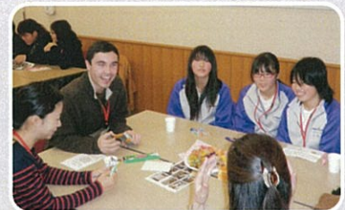
中学生も参加してくれました☆