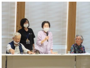
学びの仲間に自己紹介