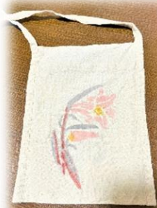
参加者の作品 (サコッシュ)