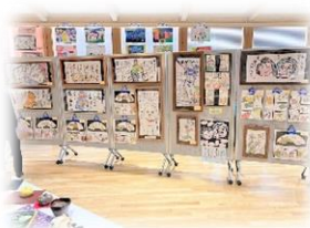
写真は昨年度（第 50 回）の様子