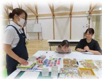
どれを使おうかな～