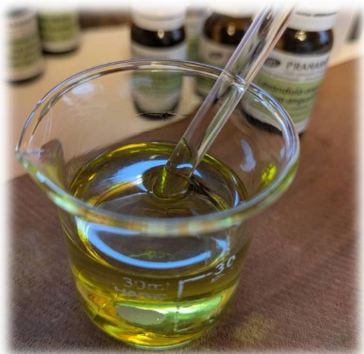
▲ケアオイル作り ※イメージです