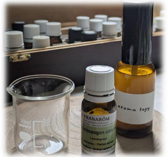
▲アロマスプレー ※イメージです