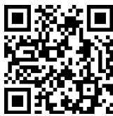
▲参加申込フォーム

フォームからお申込みされる場合は、6月12日(金)までに、いちのぴあ③番窓口にて受講料のお支払いをお願いします。