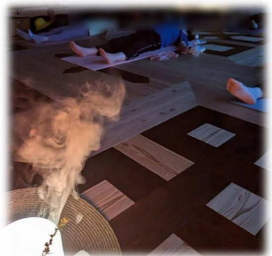
▲アロマリラックスの様子

※持ち物：動きやすい服装、水分補給用の飲み物、フェイスタオル1枚、全身が覆えるブランケット1枚