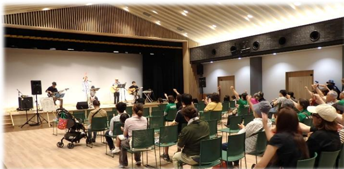
「サイキロック」ライブ (バンドの演奏)