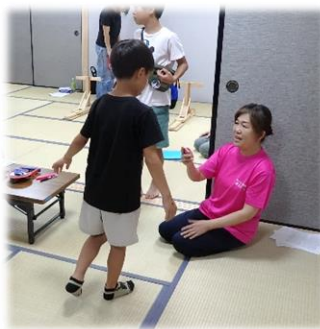
健康年齢チェック (体重体組成測定 他)