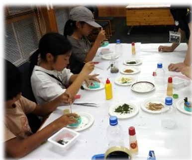
SDGs ワークショップ (ミニジオラマ作り)