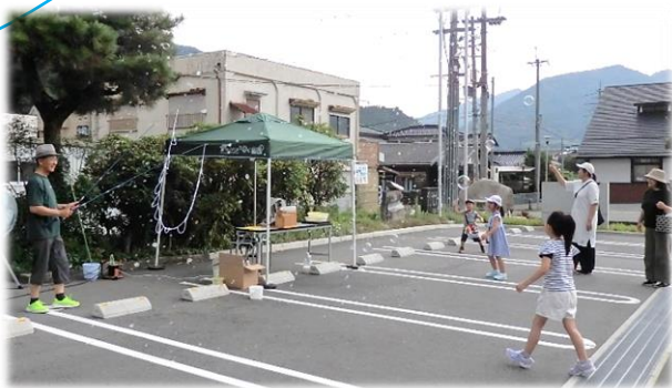
シャボン玉あそび

はがてらす夕涼み会を開催しました。厳しい暑さや天気の心配もありましたが、たくさんの方にお越しいただきました。