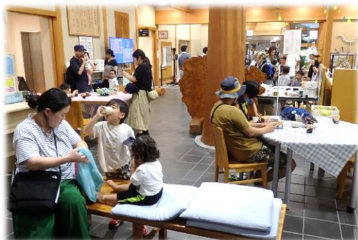
きらきらカフェ (カップケーキとジュースの販売)