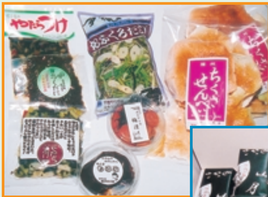
地元特産品の一部