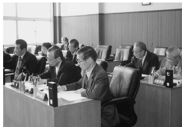
審査する予算特別委員

波賀中学校屋内運動場大規模改造事業、一宮北中学校校舎改築事業、学校給食の効率化と食教育の推進、ブックススタート事業の発足など。