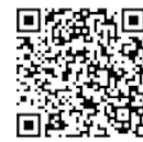
自転車運転反則金情報はこちら

建設部長 市道山田下広瀬線は、歩道の整備により大型商業施設周辺の利便性向上や土地利用の促進が期待される。横断歩道などの交通安全施設を配置するが、全線開通後の状況を観察し必要に応じて追加整備を行う。