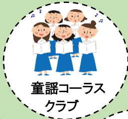
童謡コーラス クラブ