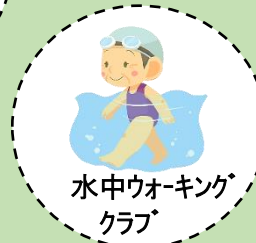
水中ウォーキング クラブ