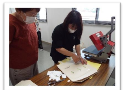
トートバッグづくり