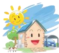
【再生可能エネルギーの利用】