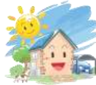
【再生可能エネルギーの利用】