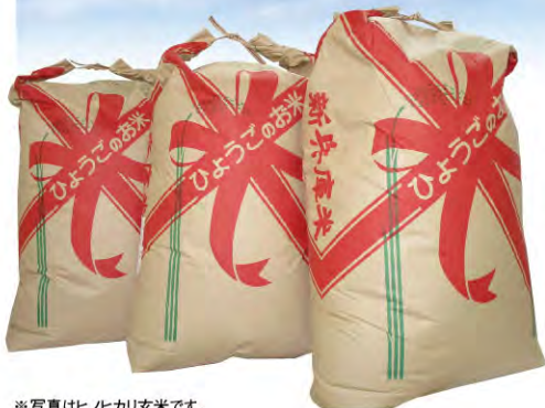
※写真はヒノヒカリ玄米です。