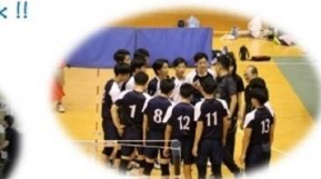
龍野高校76回生男子バレー部保護者