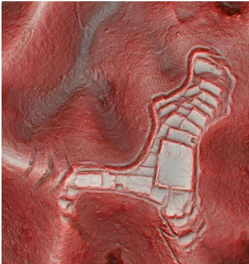
写真一二 篠ノ丸城址赤色立体図