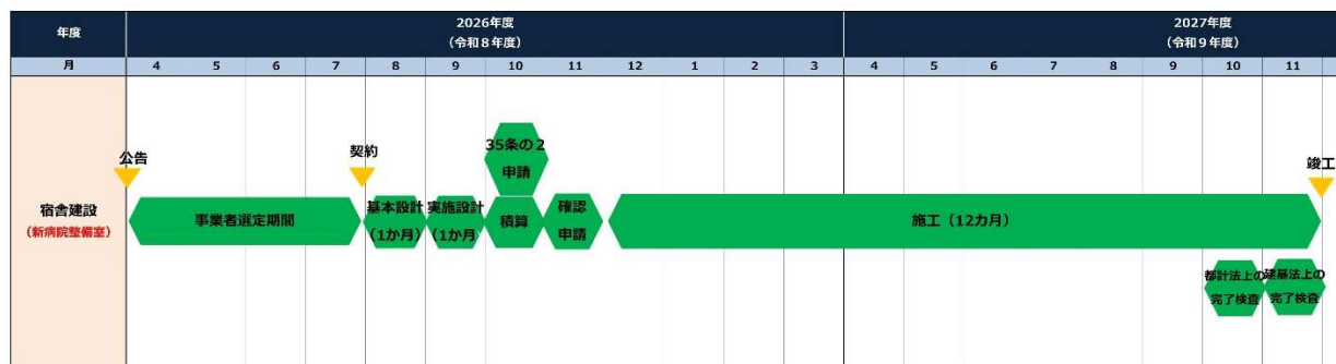
(別表2) 研修医宿舎棟建築工事 マスタースケジュール