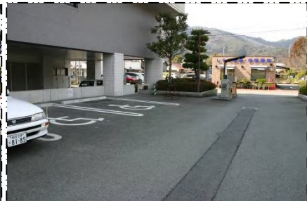
(立体駐車場入ってすぐ右)