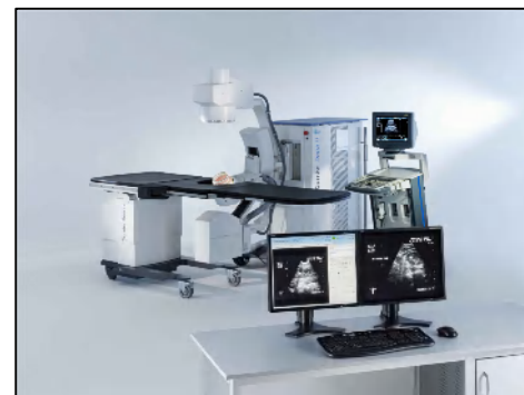
(体外衝撃波結石破砕装置)

宍粟総合病院では、泌尿器科開設時から結石破砕装置を導入し、尿路結石に対し積極的に治療を行っています。本年2月に、より破砕効果の強い新型を導入しました。より強力な破砕能力により、一回の治療ですむことが多く、入院も短期間ですみます。