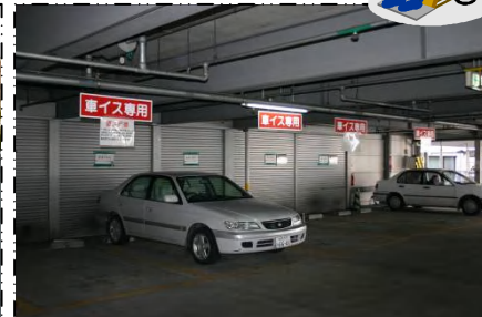
(立体駐車場2階出入り口)