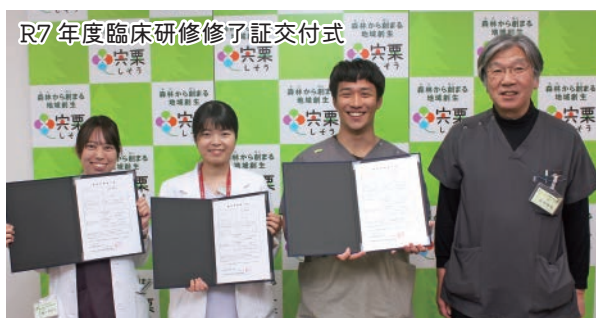
R7年度臨床研修修了証交付式

令和8年3月26日、2年間の臨床研修を修了した研修医に対して修了証を交付しました。彼らが当院で培った知識と経験を礎に今後さらに研鑽を積み、医師として大きく成長することを心より期待しています。そして将来、再び、宍粟市で地域医療にご尽力いただける日が来ることを願っています。