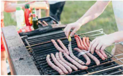
火おこしから始まる BBQ