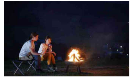
焚き火コミュニケーション