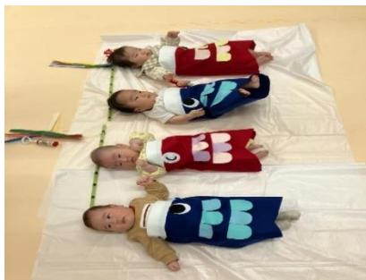
↑寝相アートを撮りました。