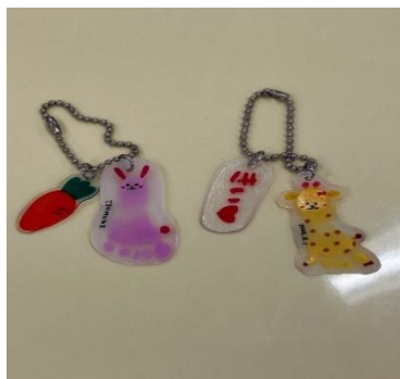
←足形アートのキーホルダーを作りました。