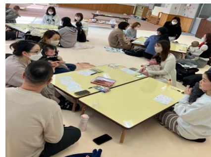
↑出産体験の振り返りを行いました。